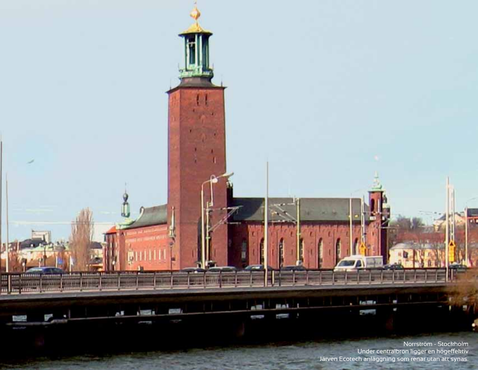
Norrström - Stockholm Under centralbron ligger en högeffektiv Järven Ecotech anläggning som renar utan att synas.

Skärbassängen eliminerar kortslutningsströmmar och ger en mycket hög uppehållstid för en effektiv reningsprocess.